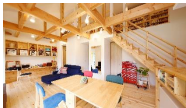
施工中のため写真はイメージです

ロフトまで吹き抜ける22帖のダイナミックなりビング。素足が心地いい木の家が完成しました。